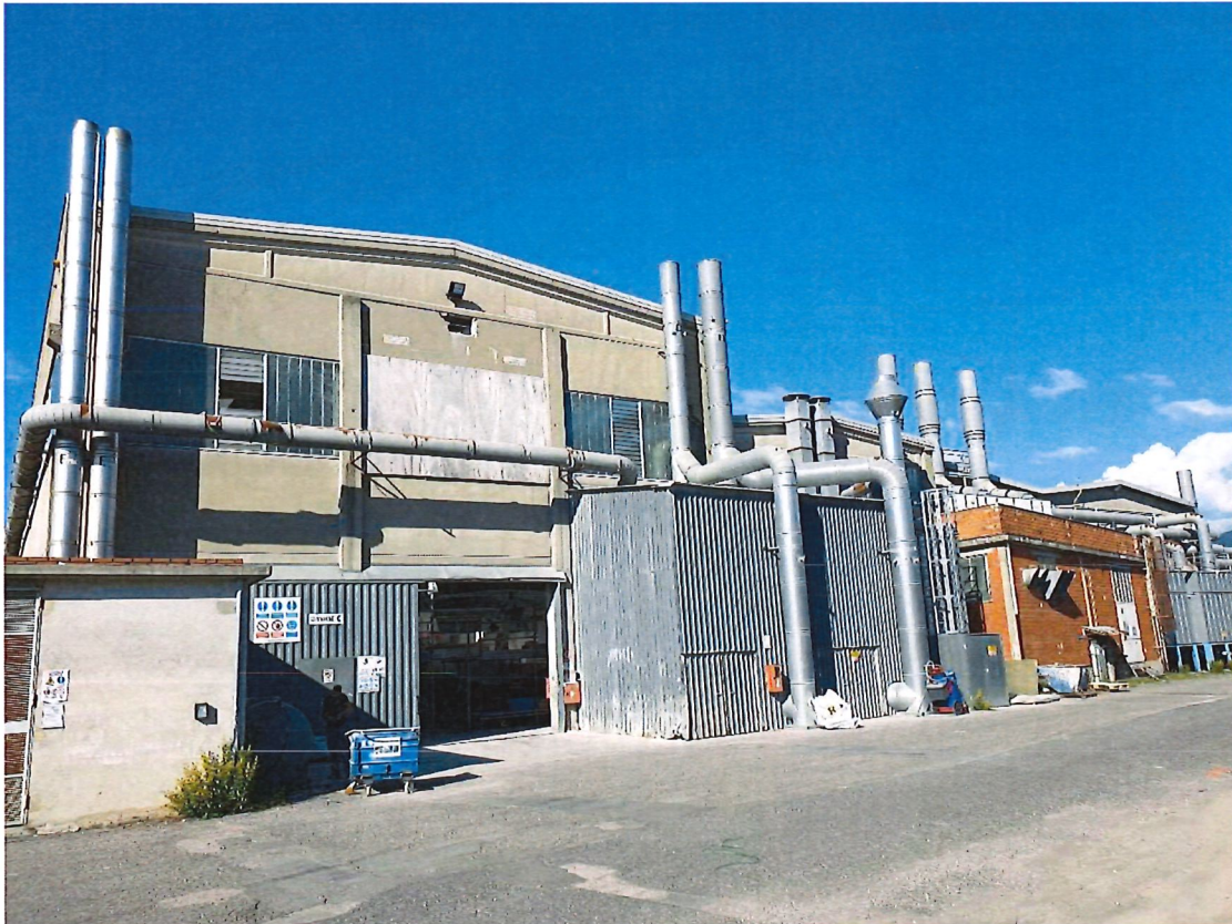
Foto 1 – Capannoni C, E, A - Prospetto sud con annessi locali tecnici e impianti