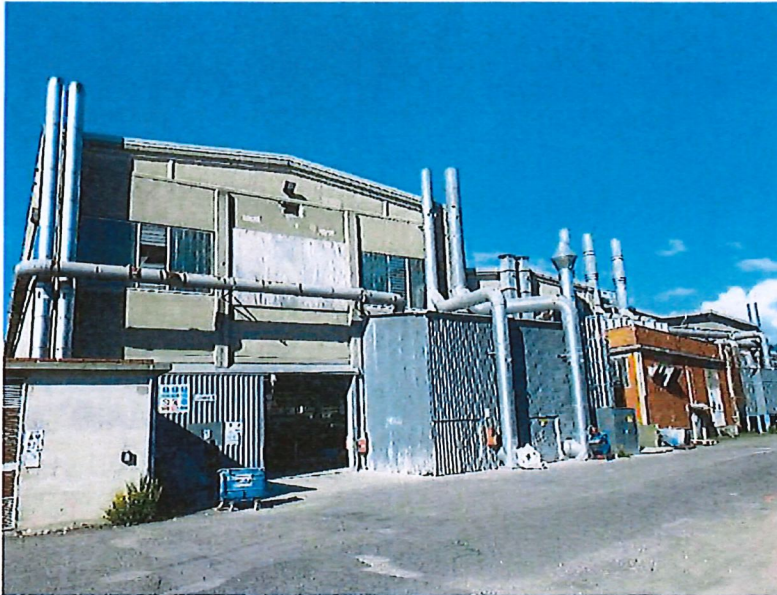
Figura 4 – Stato attuale - prospetto