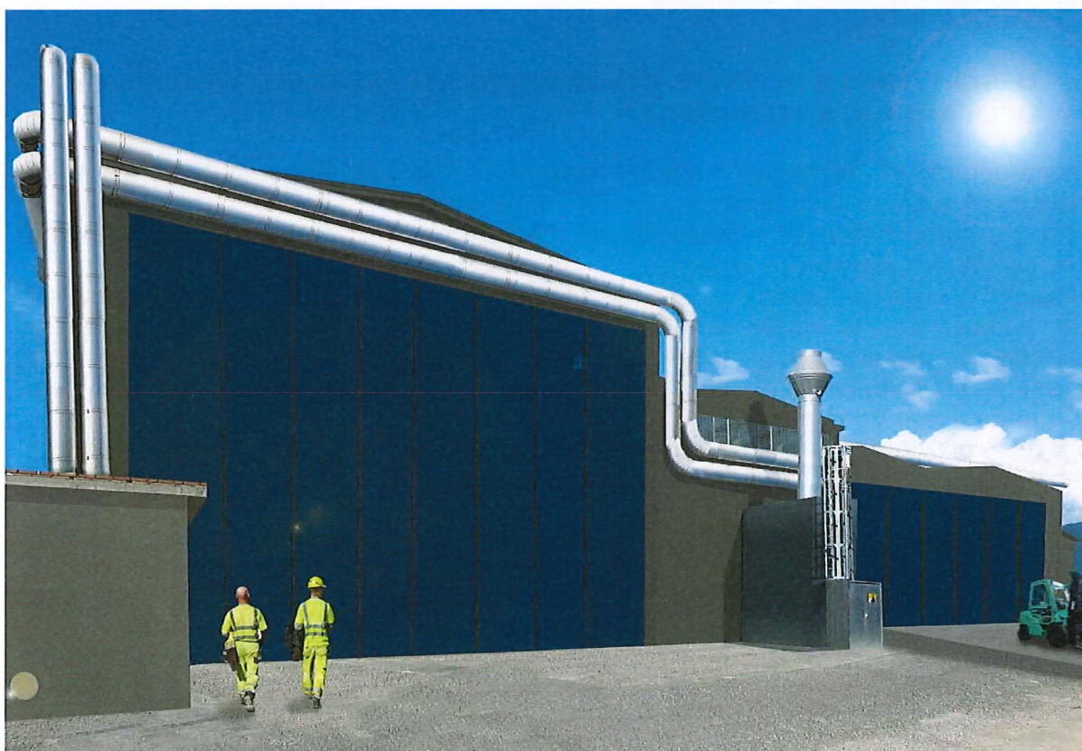
Figura 3 – Vista fotorealistica del sito oggetto di intervento

L'intervento oggetto della presente autorizzazione paesaggistica prevede anche la sistemazione dell'attuale copertura del capannone B, che verrà ripristinata con caratteristiche morfologiche e colorazione simile all'attuale.