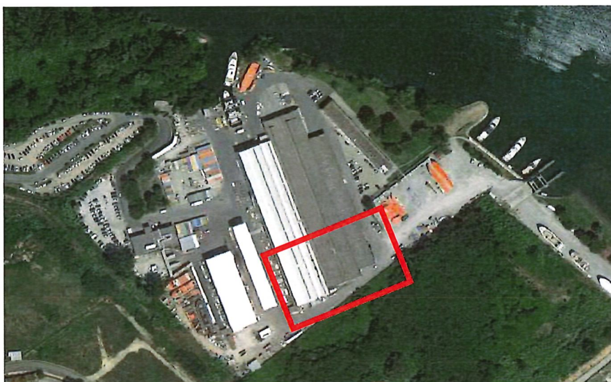
Figura 1 - foto aerea dello stabilimento produttivo di Sanlorenzo Spa